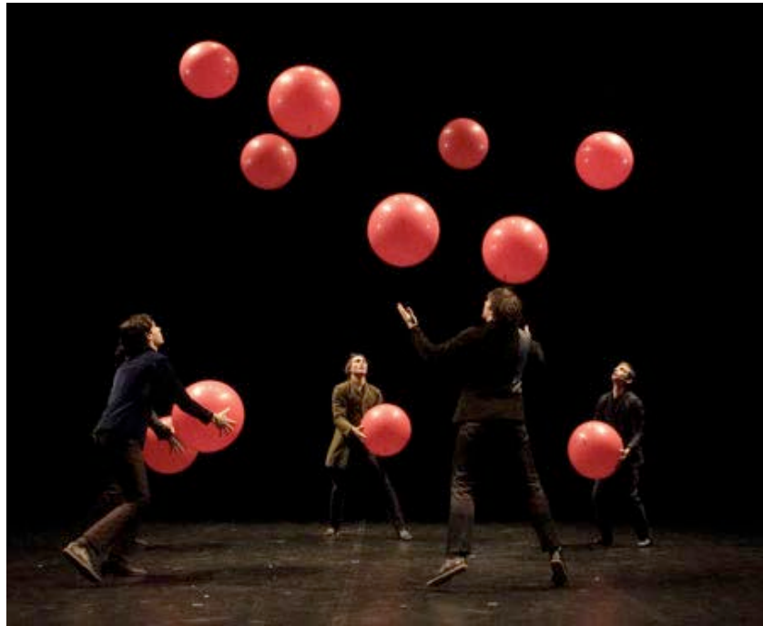
la compagnie Les Objets volants