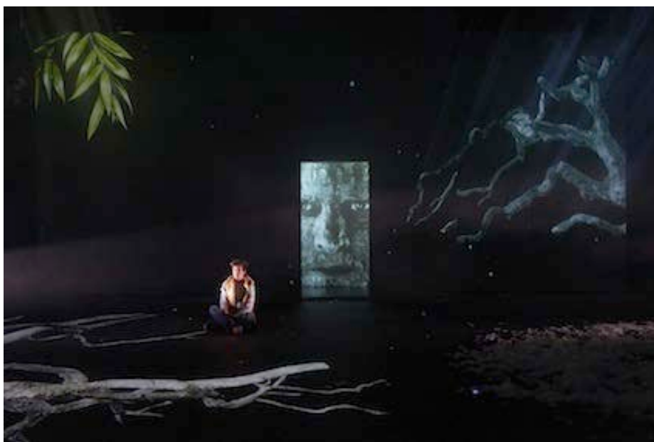
Dormir cent ans