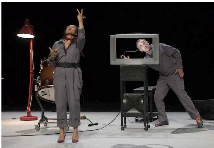
Le Thé des Poissons