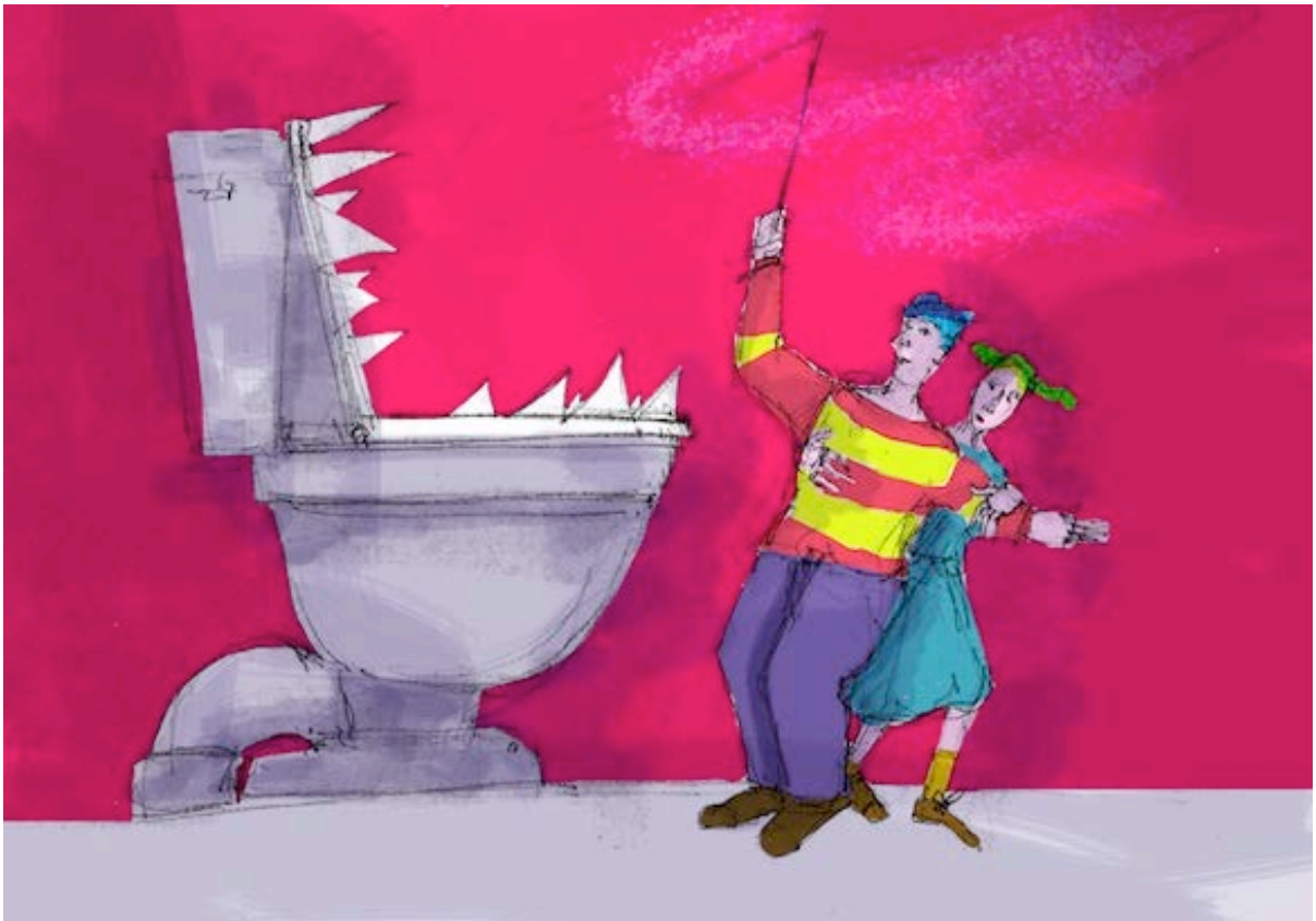
Le P'tit coin