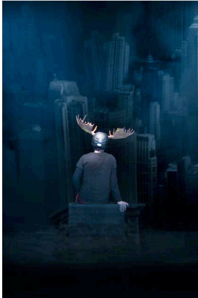
Hikikomori – Le Refuge