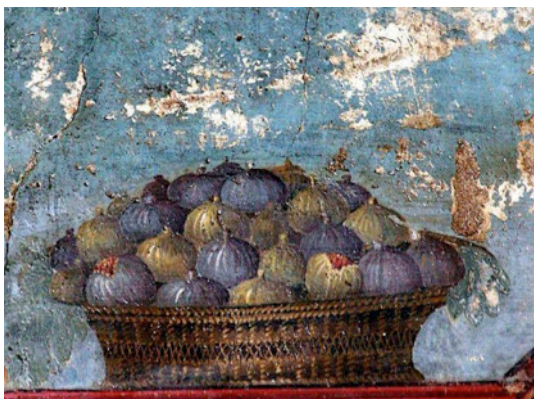
«Panier de figes», Pompéi, 79 avant J. C.

On pourrait trouver ça un peu fou de faire un spectacle autour de la nourriture... et pourtant, elle inspire beaucoup d'artistes. Par exemple des peintres, depuis l'Antiquité jusqu'à aujourd'hui.