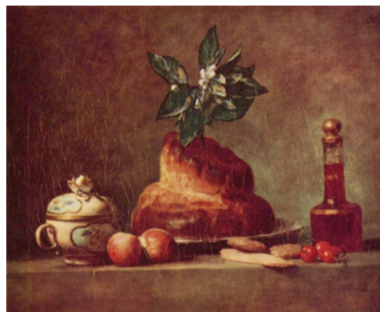
«La brioche», Chardin, 1763