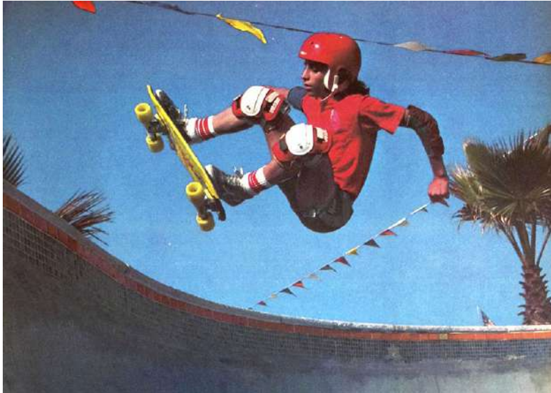
Alan 'Ollie' Gelfand, 1978

Le titre du spectacle fait référence à une figure de base du skateboard aussi nécessaire qu'immortelle inventée en 1978 par un jeune skateur de 15 ans, Allan 'Ollie' Gelfand. Tout en faisant des figures dans des piscines vides, il leva doucement le nez de son skateboard et, d'un mouvement d' écopage , s'envola dans les airs, en gardant la planche littéralement collée à ses pieds. À partir de 1981, le skateur légendaire Rodney Mullen transposa cette figure au sol et dans la rue.