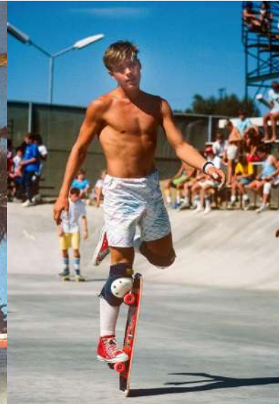
Rodney Mullen, 1981