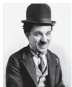
Charlie Chaplin, 1925