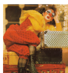
Archive du Théâtre du soleil, 1969