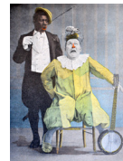
Footit et Chocolat, 1900