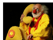
Slava Polounine, 2010