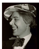
Oleg Popov, 1956