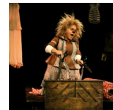
Gardi Hutter, 2010