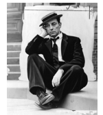
Buster Keaton, vers 1939