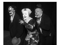
Les frères Fratellini, 1932