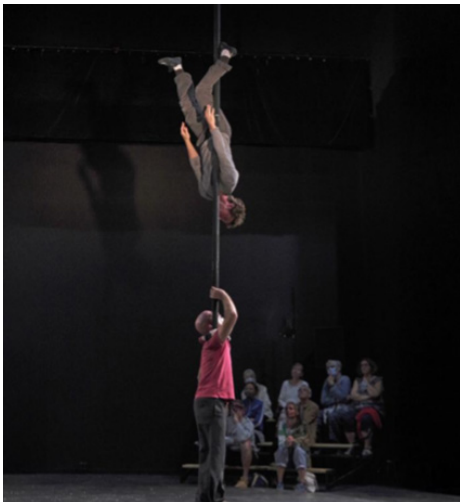
De bonnes raisons