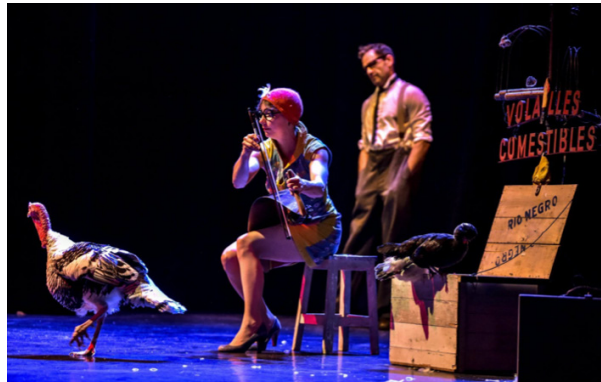
Voler dans les plumes

Si tu veux en savoir plus sur le cirque aujourd'hui, on te conseille les livres de Coline Garcia : Circassienne et Circorama .