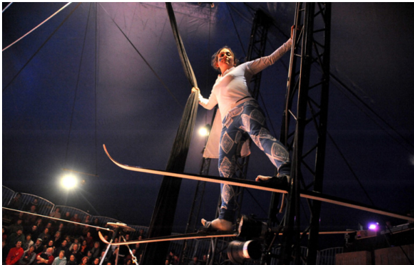
Mad in Finland

On a choisi des spectacles de cirque qui sont venus au Théâtre Am Stram Gram ces dernières années, tu en as peut-être vu certains ?