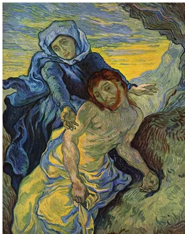
PIÈTA Vincent van Gogh

À gauche: Eugène Delacroix, «Pieta», vers 1850.