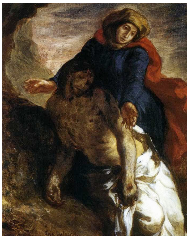
PIÈTA Eugène Delacroix