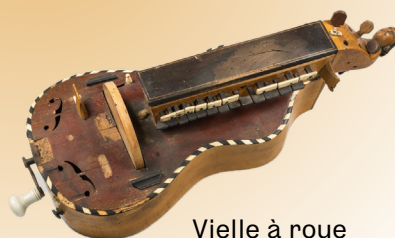
Vielle à roue

Pour un bain musical , l'équipe du spectacle vous suggère quelques-unes de ses sources d'inspiration :