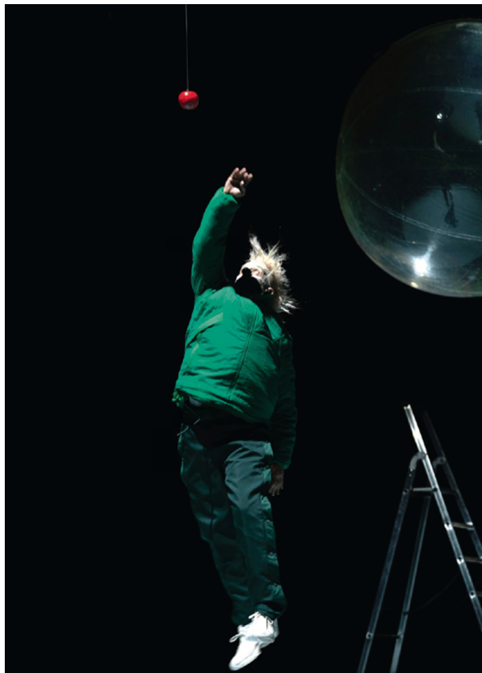
SCÈNE «Actapalabra», magnifique fantasmagorie sans paroles pour deux clowns lancée par le Théâtre Am Stram Gram, déchaine le jeune public. Après Genève, le spectacle tournera à Paris, puis à Lausanne.