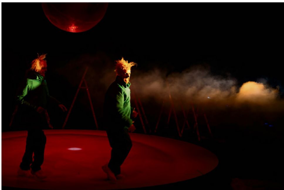
Le duo ne cède à aucune facilité, ce qui rend la fièvre du jeune public encore plus magique et le charme de ce spectacle encore plus grand. (ARIANE CATTON)