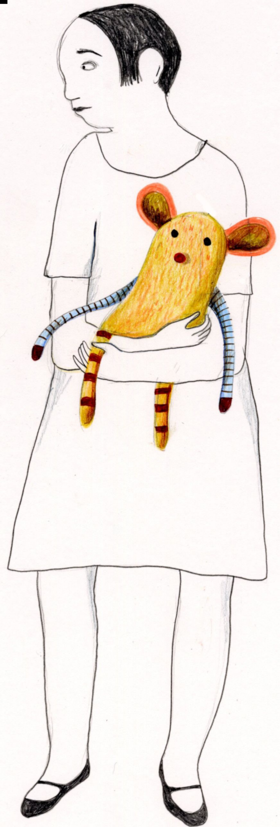
Illustration : Albertine